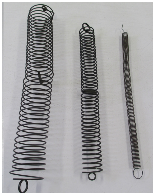
Figura 1 - Molas